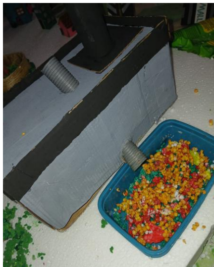
Figura 1: Maquete representando o descarte de efluentes aquecidos no rio e seus impactos no ecossistema aquático.