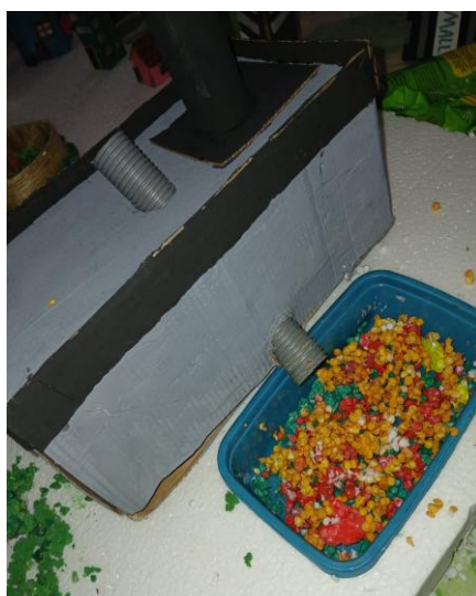
Figura 1: Maquete representando o descarte de efluentes aquecidos no rio e seus impactos no ecossistema aquático.